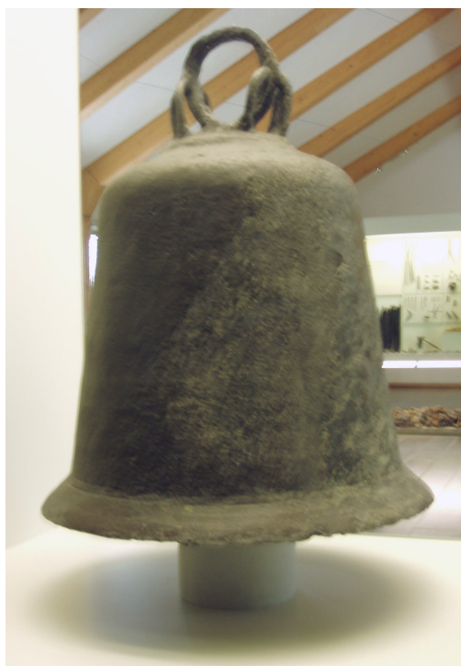
Hedebyklokken i Hedebymuseet

Da vor Herre og Biskop havde faaet denne Tilladelse, satte han straks i Værk, hvad han længe havde ønsket: han byggede der en Kirke til den hellige Guds Moder Marias Ære og indsatte der en Præst; og nu begyndte Guds Naade paa dette Sted at vokse og bære Frugt. Thi der var alt tilforn mange kristne, som havde været døbte enten i Dorstad eller i Hamborg. — blandt dem var nogle af de fornemste i samme By — og de vare glade ved, at der gaves deri Lejlighed til at udøve deres kristne Gudsdyrkelse.