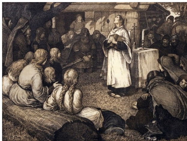
Ansgar prædiker (Louis Moe, 1898)

Ovennævnte Harald betroede dem ogsaa nogle af sine, som de skulde drage Omsorg for og oplære. Og saaledes skete det, at de i kort Tid der fik en Skole oprettet paa 12 eller flere Drengene. De skaffede sig ogsaa, her og der fra, andre Tjenere og Medhjælpere, og Rygtet om dem og deres Fromhed begyndte under Guds Velsignelse at vokse og bære Frugt.