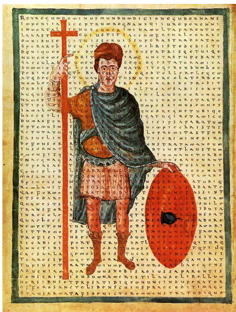
Samtidig gengivelse fra 826 af Ludvig den Fromme som miles christianus

Han søgte hans Højhed Kejsers Ludvig [den Fromme] paa Haand og bad ham hjælpe sig, at han kunde faa sit Rige igen. Kejseren beholdt ham hos sig og formanede ham baade selv og ved andre til at antage Kristendommen, for at der saaledes kunde være større Fortrolighed imellem dem; og det kristne Folk vilde da komme ham og hans Undersaatter villigere til Hjælp, naar man paa begge Sider dyrkede samme Gud.