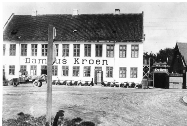
Fig. 5: Damhuskroen i 1922.

over for hende, at hun den aften, mordet blev begået, havde været sammen med en anden kvinde og en sømand i værtshuset "Den Fingerløse" på Åboulevarden. Sømanden var meget vred på den dræbte chauffør, fordi han havde taget en kæreste fra ham. De havde derfor tilkaldt ham telefonisk og bedt ham køre mod Rødovre. På markvejen ved Damhuskroen havde en af dem så skudt ham.