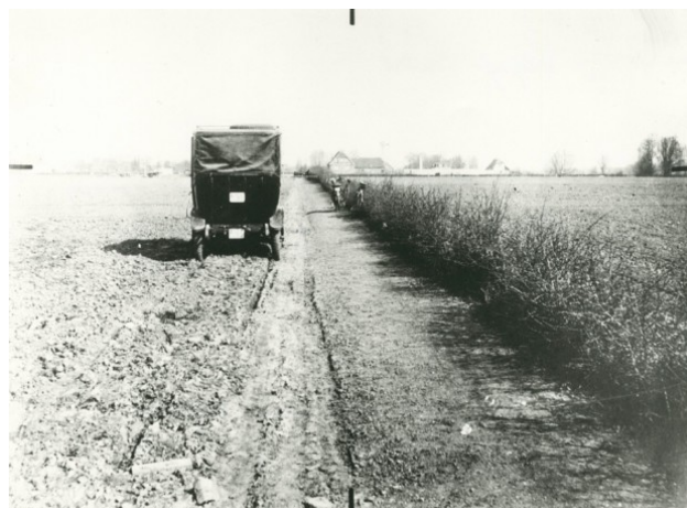
Fig. 2: Taxa Vogn A. 7516 på markvejen ved Damhussøen. I baggrunden ses Thygesens Gartneri