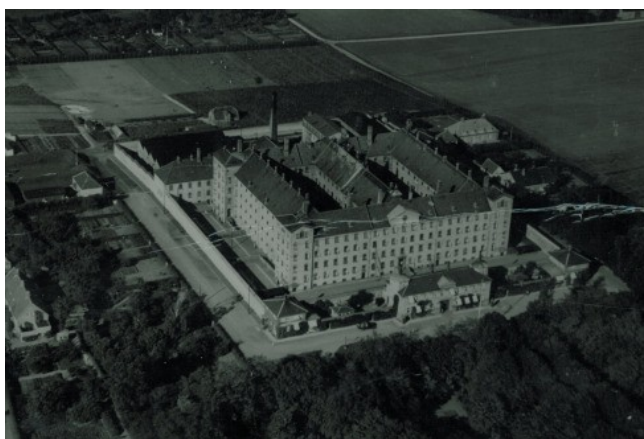
Fig. 1: Horsens Statsfængsel i 1930.