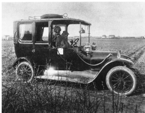
Fig. 3: Synet, der mødte Jeppe Jepsen.

Søndre Birks politi blev hurtigt tilkaldt, og de indledende undersøgelser påbegyndtes.