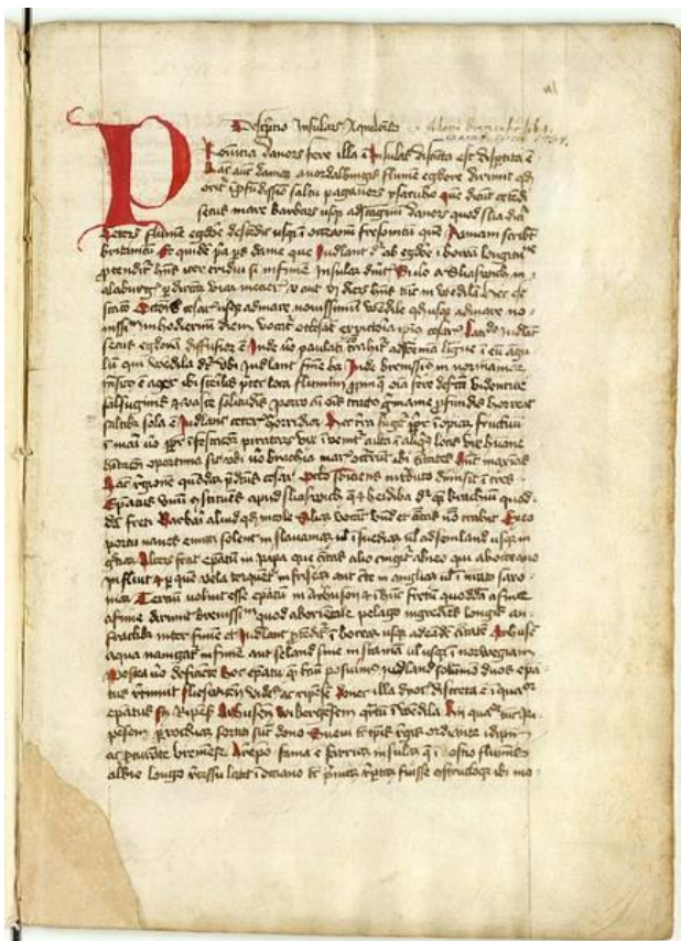
Håndskrift med Adam af Bremens krønike.

Herre er Jesus Christus til Gud Faders Ære, han som lever og regjerer med Faderen og den Hellig Aand i al Evigheds Evighed! Amen.