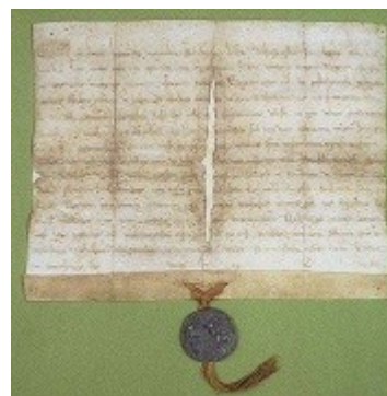
Pave Urban III's Stadfæstelsesbrev (1186)

Første gang Vanløse nævnes er i et i 1186 affattet pavelig stadfæstelsesbrev fra pave Urban den 3. (pave 1185-1187) til biskop Absalon : 13