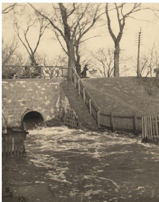
Damhuslusen under Roskilde Landevej ved Damhuskroen ca. 1900

Som det fremgår af ovenstående, synes ingen af de gamle tolkninger at holde. Vanløse betyder hverken 'den vandlidende', 'skråningen, hvor der vokser kvan' eller lignende. Snarest må vi tolke stednavnet som 'lysningen ved [åen] Hwatn 16 - og åen er stadig "hurtig", selvom det er over 1000 år siden, man navngav den og sidenhen rettede den ud og "pyntede" den med kommunale fliser.