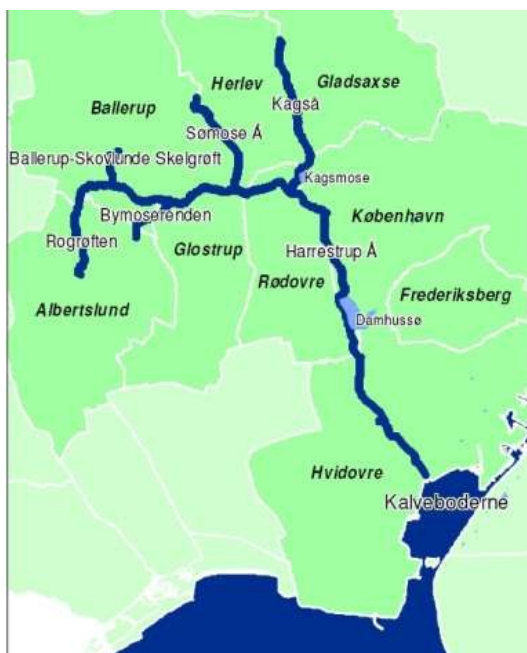
Harrestrup Ås forløb (Illustration: Københavns Spildevandsplan 2004)