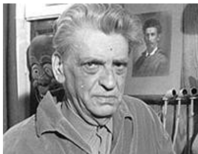
R. Broby-Johansen omkr. 1970

Da forfatteren og kunstneren Rudolf Broby-Johansen (1900-1987) i 1959 udgav sin bog Gennem det ny København 1 , hvor han beskrev sine vandreture i kvartererne uden for Københavns volde, besøgte han også Vanløse. Turen gik fra Vanløse station via Jernbane Allé og Grøndals Parkvej til Damhussøen, forbi barakkerne, og endte på Jyllingevej station.