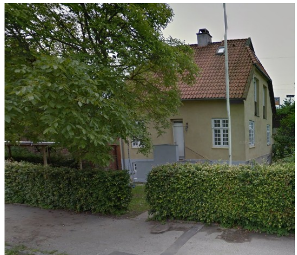
Fig. 2: Herlufholmsvej 59 i dag.